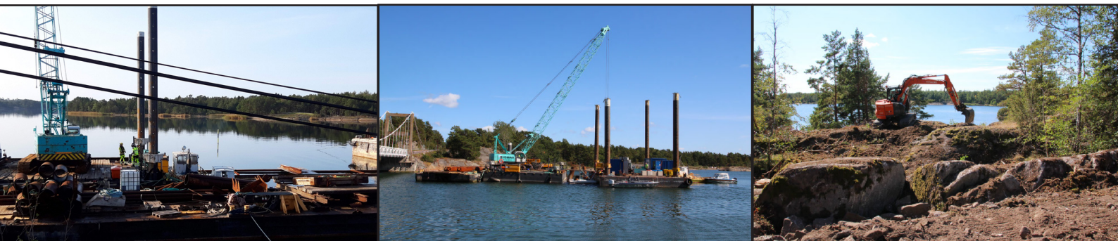
Bilder från arbetet med pålningen av tillfällig bro, till vänster skimtar den gamla bron.